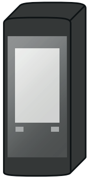
Kontrolér Tensor ST